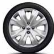
Декоративний ковпак Decade R15