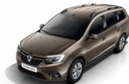
CNM Коричневий попіл