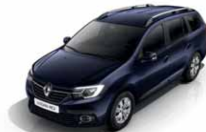
D42 Синій Navy (лак)