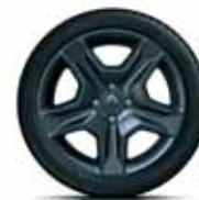
Декоративний ковпак Cross R16*

* Доступний при замовленні лімітованої версії Stepway Cross