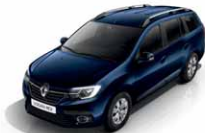
RPR Синій космос