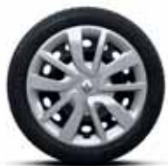
Декоративний ковпак Magiceo R15