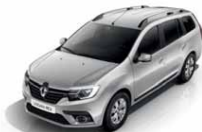
D69 Сіра платина