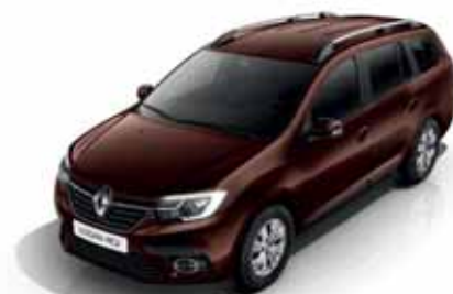
CNG Коричневий турмалін