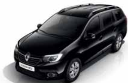
676 Чорна перлина