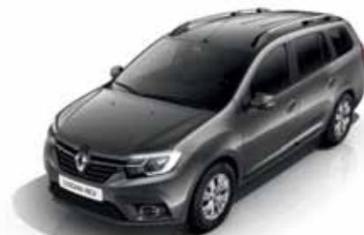
KNA Сіра комета