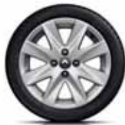
Легкосплавний диск Symphonie R15