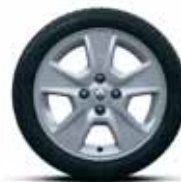
Легкосплавний диск Nepta R15