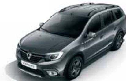
KPV Сірий камінь*