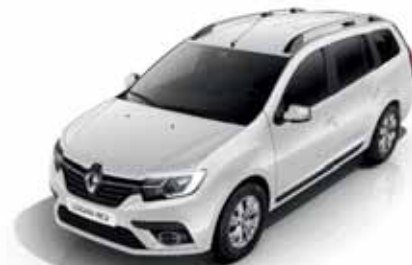
369 Білий лід (лак)